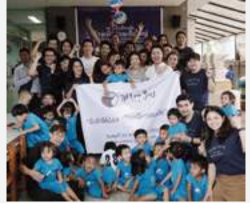
กิจกรรมเลี้ยงอาหารกลางวันและขนมให้กับเด็กที่มูลนิธิบ้านเด็กขอนแก่นเสื่อใหญ่ (รัชดา)