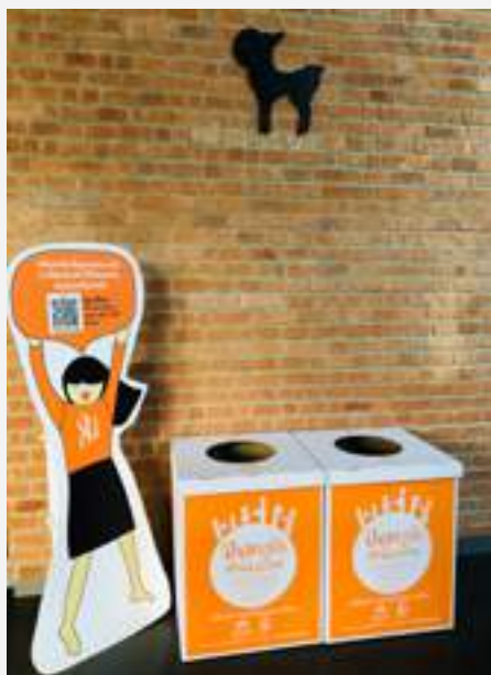
รับบริจาคสิ่งของเพื่อนำไปจำหน่ายในร้านปันกันเพื่อนำรายได้เป็นทุนการศึกษาให้เด็กในมูลนิธิยูพัฒนา