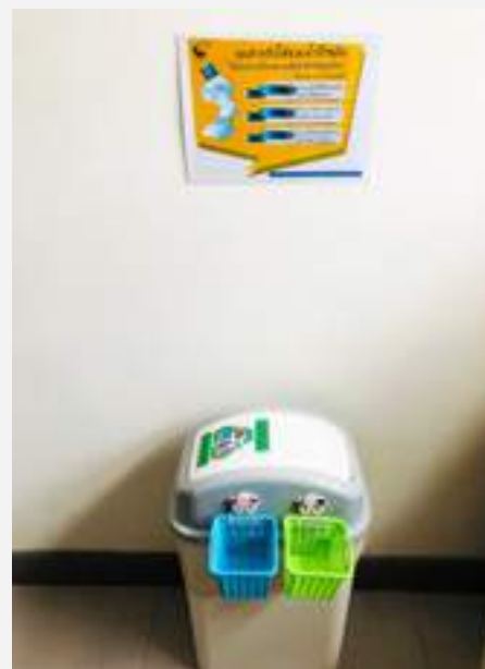
รับบริจาคขวดน้ำพลาสติกที่ใช้แล้วทิ้งเพื่อนำไปทอเป็นผ้าไตร หรือผ้าบังสุกุลจีวร ร่วมกับวัดจากแดง