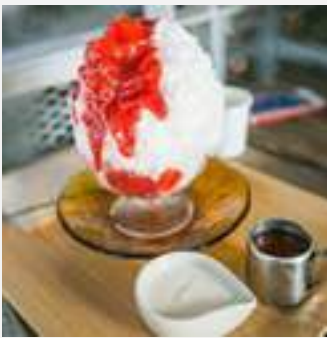
Ichigo and Yogurt

ในปี 2558 เมฆน้ำแข็งใส คาเฟ่โกริ ที่ให้บริการในร้าน ออฟเตอร์ ยู ได้รับความนิยมและผลตอบรับที่ดีจากผู้บริโภคเป็นอย่างมาก จนได้รับการบรรจุเป็นเมนูหลักของร้าน ในปี 2559 บริษัทฯ เล็งเห็นโอกาสทางธุรกิจในการขยายฐานผู้บริโภค บริษัทฯ จึงได้ขยายสายผลิตภัณฑ์สู่ร้านน้ำแข็งใสภายใต้ชื่อ " เมโกริ " ซึ่งร้านน้ำแข็งใสนี้มีแนวทางการตกแต่งร้านที่ให้บรรยากาศแบบสบายเป็นกันเอง ทำให้ผู้บริโภครู้สึกผ่อนคลายเหมือนอยู่บ้าน ด้วยแนวคิดของร้านน้ำแข็งใสที่เป็นของหวานคู่กับเขตเมืองร้อนของประเทศไทย กลุ่มผู้บริโภคจึงมีความหลากหลายไม่ใช่เพียงแค่กลุ่ม นักเรียน นักศึกษา คนทำงาน เท่านั้น แต่ครอบคลุมไปถึงกลุ่มแม่บ้าน ไปจนถึงผู้สูงอายุ ซึ่งมีผลิตภัณฑ์เป็นน้ำแข็งใสหลากหลายเมนูที่ถูกเลือกสรรพิเศษ อาทิ Ichigo and yogurt, Mont Blanc Chestnut, Hojicha, Ume เป็นต้น