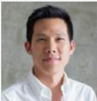
นายแม่ทัพ ต.สุวรรณ กรรมการ และ กรรมการผู้จัดการ