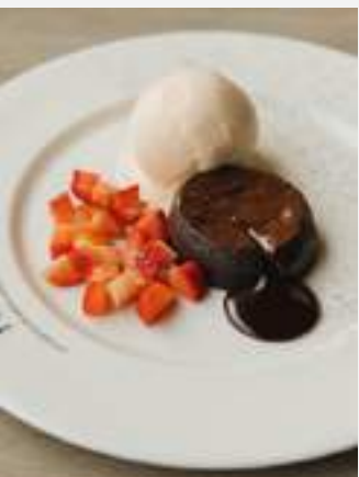
ช็อคโกแลตลาวา