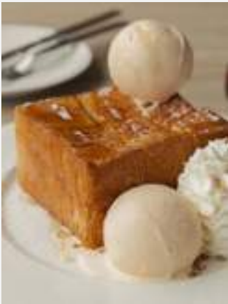
ซินยู่า ฮันนี่โทสต์