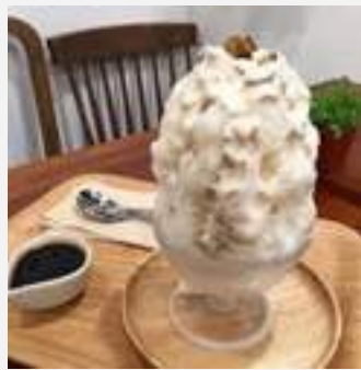
Mont Blanc Chestnut