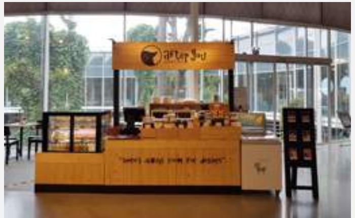
การขายนอกสถานที่