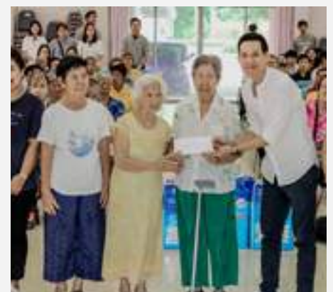
กิจกรรมเลี้ยงอาหารกลางวันและขนมแก่ผู้สูงอายุที่ศูนย์พัฒนาการจัดสวัสดิการสังคมผู้สูงอายุบ้านบางแค