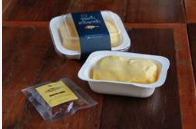
รายได้ส่วนหนึ่งจากการจำหน่าย “ขนมปังคาโบนาห์ล่า” มอบให้ กับ โครงการเพื่อการศึกษา Limited Education

นอกจากนี้ บริษัทฯ ได้ร่วมลงนามบันทึกข้อตกลงความร่วมมือเพื่อการจัดการศึกษาด้านอาชีวศึกษา (MOU) ในการเข้าร่วมโครงการอาชีวศึกษาระบบทวิภาคีกับวิทยาลัยต่างๆ มากกว่า 10 แห่ง ซึ่งเป็นการเรียนในสถานศึกษาควบคู่ไปกับการทำงานจริงในสถานประกอบการ เน้นให้ผู้เรียนในสาขาวิชาชีพได้มีโอกาสฝึกงานภาคปฏิบัติในสถานประกอบการ เพื่อให้ผู้จบการศึกษาออกไปเป็นผู้ที่มีความรู้ ความสามารถในวิชาชีพนั้นๆ อย่างแท้จริงและมีคุณภาพตรงตามความต้องการของสถานประกอบการ