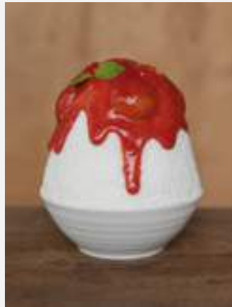
สตอว์เบอร์รี่ ชีสเค้ก คากิโกริ